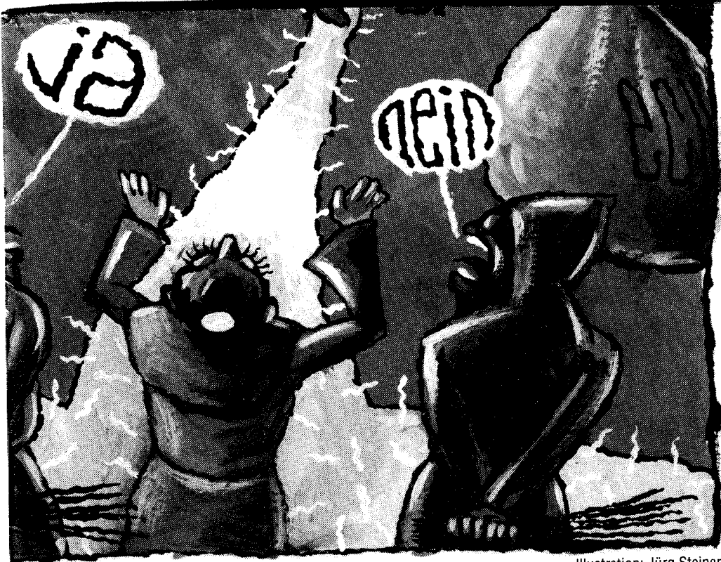
Illustration: Jürg Steiner

Als wir aber sahen, wie der EWR als Perspektive und als Alternative verkauft wurde, sind wir zum Schluss gekommen: Nein, diese Illusion unterstützen wir nicht, wir sagen klar nein.